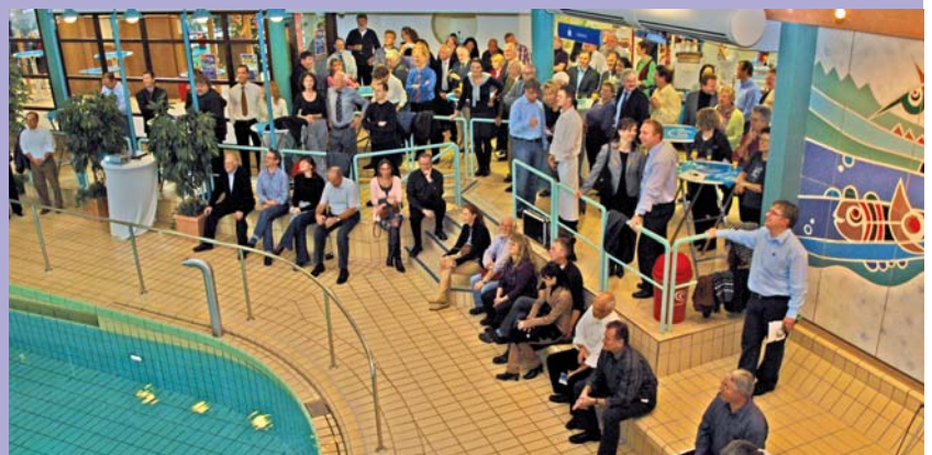
20 Jahre Badepark in Haßloch. Rund 3,8 Millionen Gäste haben das Freizeitbad seitdem besucht. Allein im Jahr 2010 werden es nach Schätzungen wieder über 160-tausend Badebegeisterte gewesen sein.