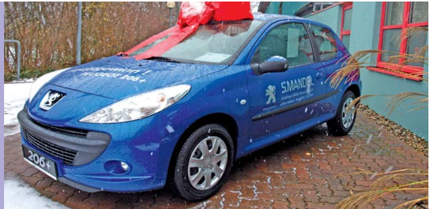
Der Hauptpreis bei der Jubiläumsverlosung: ein Peugeot 206+ des Autohauses SMANDL. Der Gewinn geht an den Inhaber des Loses mit der Nummer 76240.

Der Badepark gehöre fest zu Haßloch, so Bürgermeister Ihlenfeld abschließend. Geschätzt über 160-tausend Besucher allein im Jahre 2010 machten erneut deutlich, wie verankert das Freizeitbad in der Gemeinde sei. "Auch wenn die Finanzierung mitunter schwierig ist", so Ihlenfeld, weil kommunale Haushalte immer weniger in der Lage seien, größere Defizite zu verdauen. "Der Badepark ist eine wichtige kommunale Einrichtung und wir werden gemeinsam mit den Gemeindefreizeitwerken Haßloch alles unternehmen, damit wir noch sehr lange erfolgreich dieses schöne Bad betreiben können".