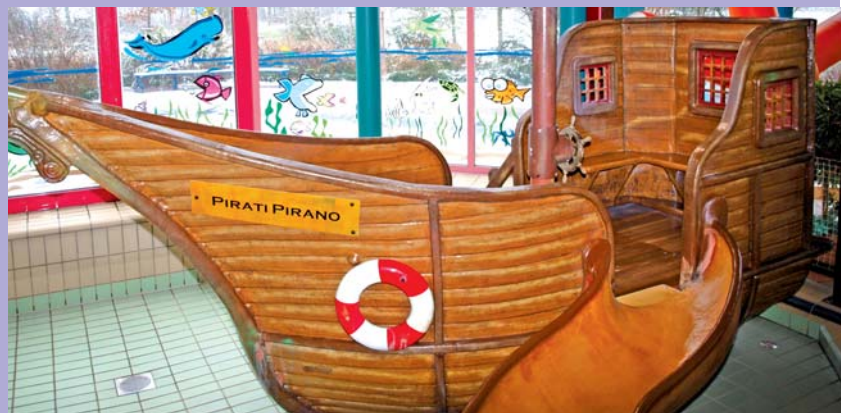
Eine Attraktion für Kinder und Jugendliche - das Piratenschiff im Badepark. Erbaut wurde das Spielgerät im Jahre 2006.