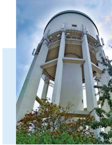
Wahrzeichen der Haßlocher Wasserversorgung, der Wasserturm in Duttweiler. Baujahr: 1929 Höhe: 40 Meter

Aus den Brunnen darf grundsätzlich nicht mehr Wasser entnommen werden, als das System ganz natürlich nachzubilden in der Lage ist. "Dadurch wird zuverlässig vermieden, dass der Brunnen trocken gezogen wird", erläutert Schäfer. Er führt viele der regelmäßigen Kontrollen eigenhändig durch. "Trinkwasser ist in Deutschland das am besten kontrollierte Lebensmittel überhaupt", lässt er keinen Zweifel. Allein rund 30 Mal im Jahr erfolgen regelmäßige Laborprüfungen auf Keimfreiheit. "Wenn man den ganzen Aufwand kennt und weiß, wie akribisch wir bei den Gemeindewerken am Produkt Trinkwasser arbeiten, nimmt es fast Wunder, dass der Wasserpreis im zurückliegenden Jahrzehnt absolut stabil geblieben ist. Aber für unsere GWH-Kundinnen und Kunden ist das ja gut so." Wie gesagt: Dieser Mann ist mit sich im Reinen und das Haßlocher Trinkwasser ist für ihn in den vergangenen über 30 Jahren zu seiner Berufung geworden.