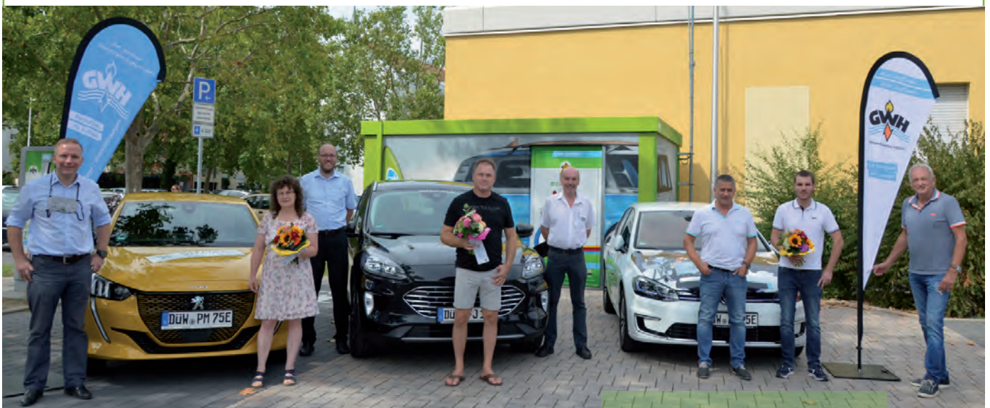
Die glücklichen Gewinner