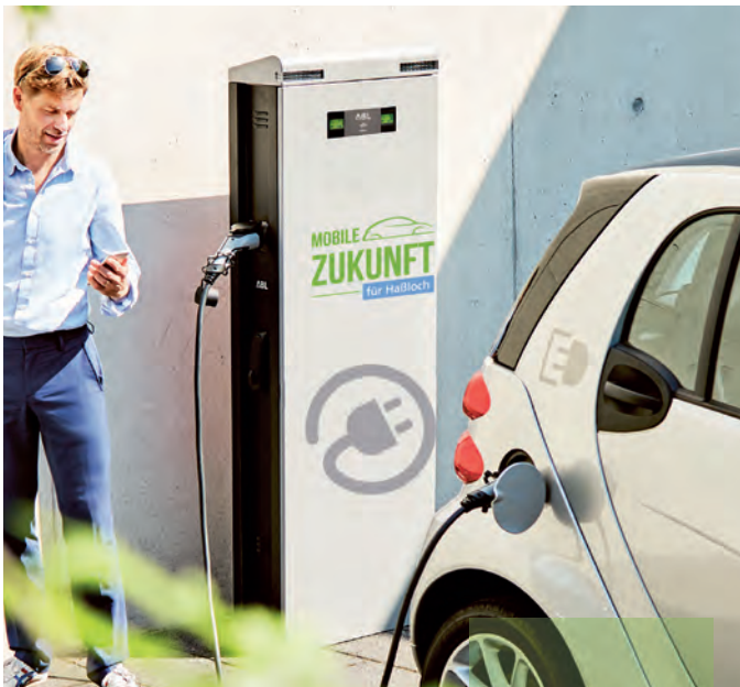
Ladesäule in Haßloch