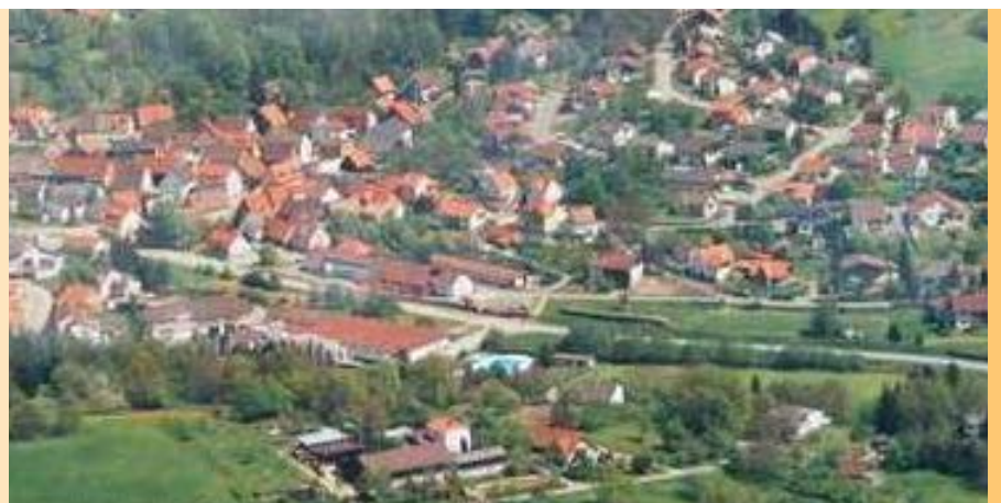
Gemeinde Schefflenz aus der Luft