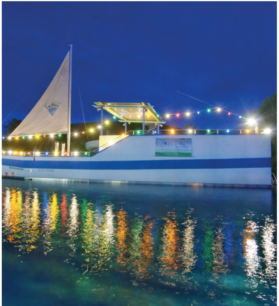
Candle-Light-Schwimmen - der Geheimtipp im faMos findet auch dieses Jahr wieder statt

Das beliebte Candle-Light-Schwimmen mit All-You-Can-Eat-Bufferet, ein Geheimtipp unter Odenwälder Badefans, wird es auch 2011 geben, so viel steht fest. Auch der Fitness-Tag, der in der Vergangenheit oft schon sehr gut besucht war, ist von den faMos-Machern eingeplant. Ob die Spiele der Frauen-Fußball-Weltmeisterschaft live im Bad übertragen werden, ist noch nicht entschieden, wird aber überlegt. „Wir fragen in den ersten Wochen der neuen Saison unsere Badegäste, ob sie Inter-