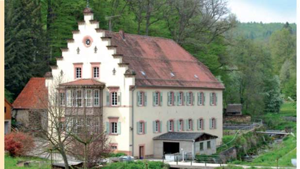
Impression von Elztal-Dallau