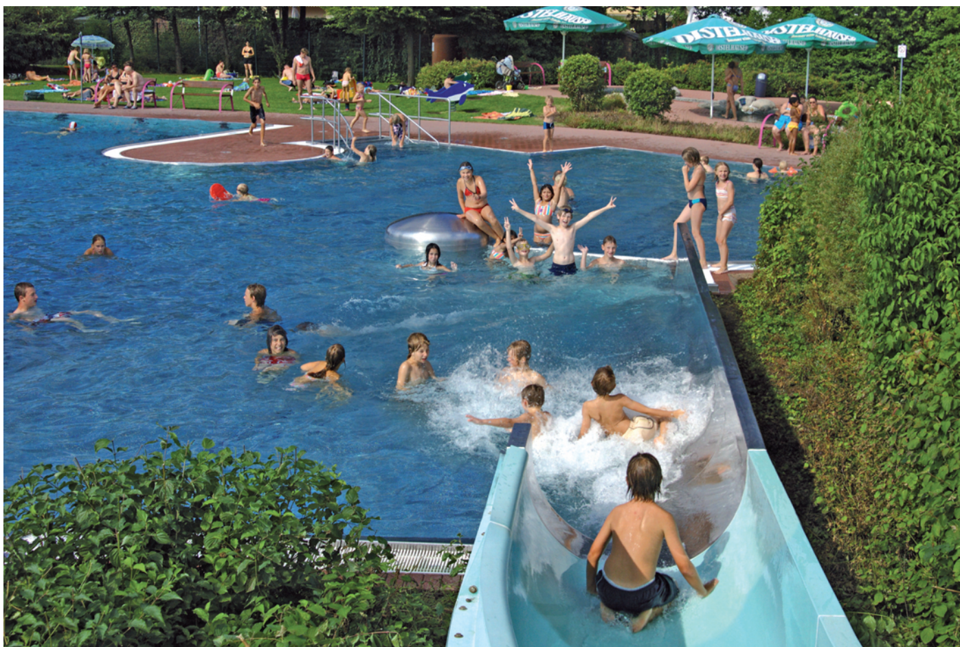
75-m-Riesenrutsche - eine der beliebtesten Attraktionen im faMos