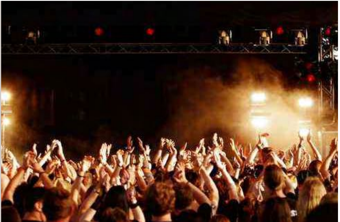
Wieder eine Rocklegende live im Großen Elzpark: Joe Cocker

unterschiedlichen Songschreibern wie Carlos Santana, Bob Marley, Prince, Stevie Wonder, Randy Newman, Bob Dylan, John Lennon, Eric Clapton oder Leonard Cohen derart einfühlsam und eigenständig zu interpretieren, bedarf es sehr wohl einer ganzen Menge Gespür für die Stimmung eines Lieds.