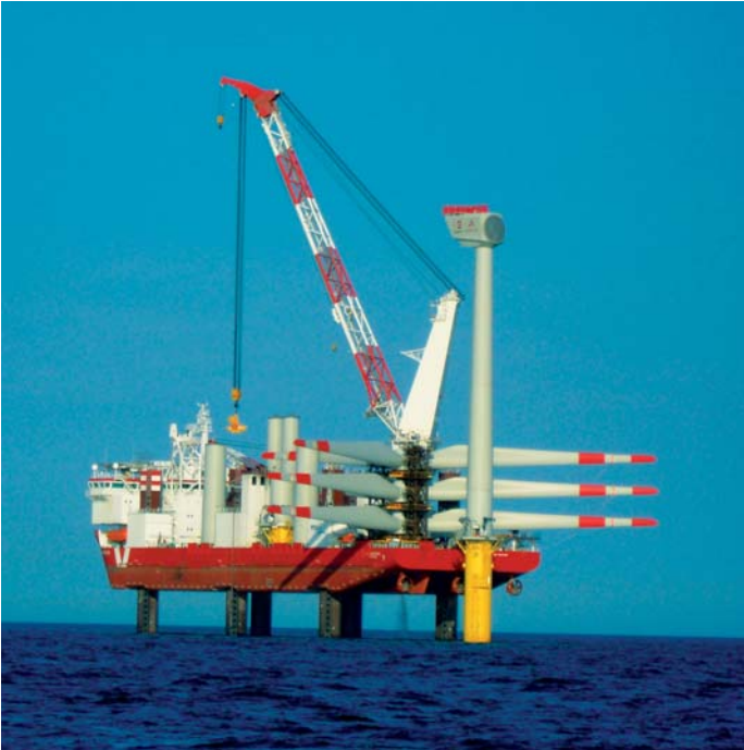
Errichtung einer Windkraftanlage in der Nordsee