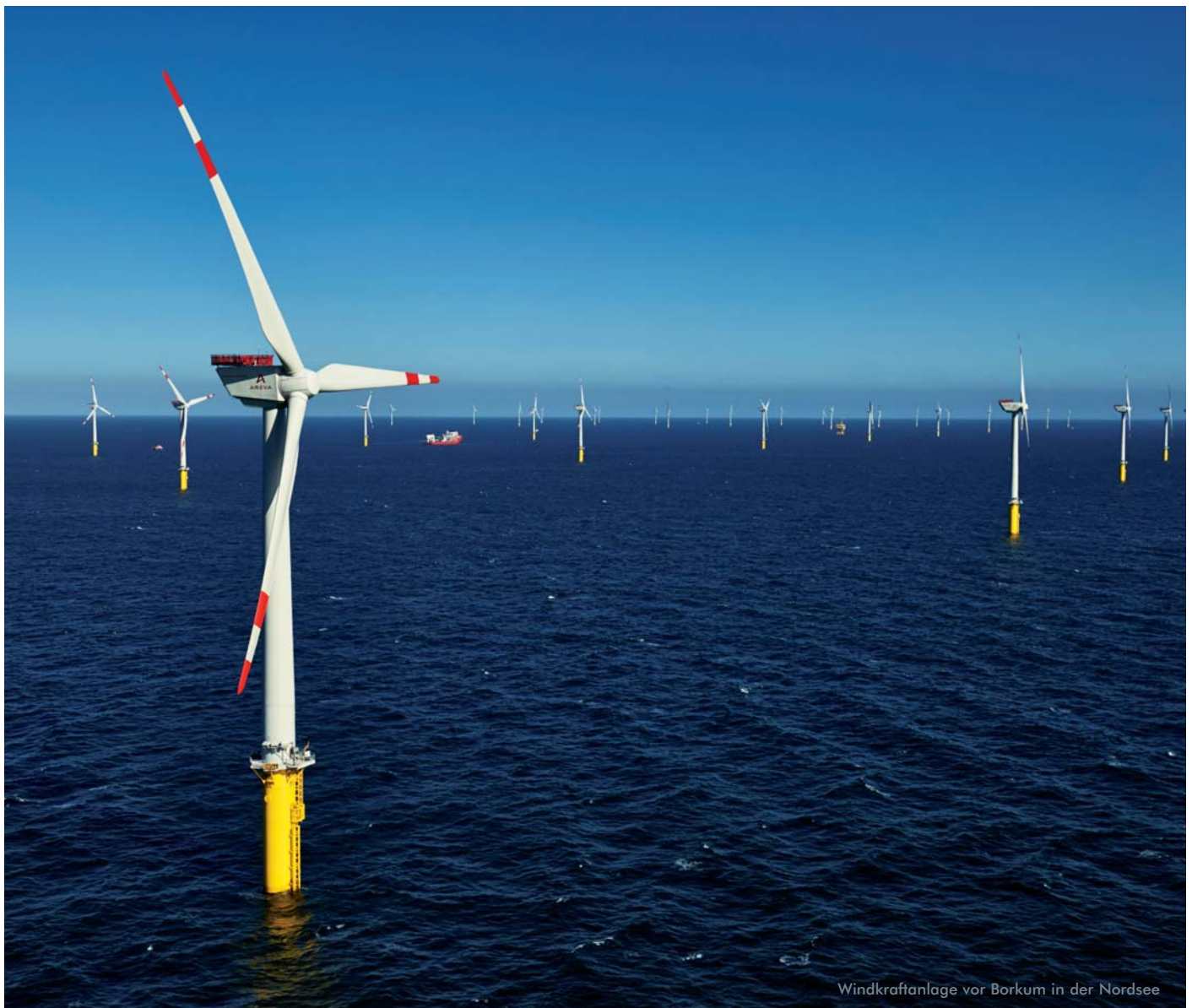
Windkraftanlage vor Borkum in der Nordsee

Der Bauplatz für den Trianel Windpark Borkum II liegt in der Nordsee, 45 Kilometer vor der Küste Borkums, in direkter Nachbarschaft zur ersten Ausbaustufe des kommunalen Windparks. Bis spätestens Ende 2019 sollen die 32 Windkraftanlagen mit einer Gesamtleistung von rund 203 MW vollständig errichtet werden und ans Netz gehen.