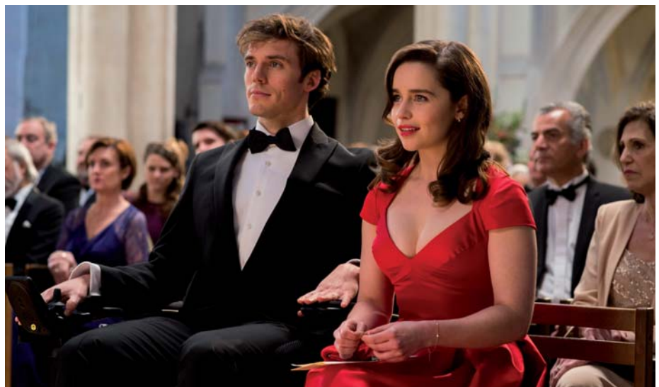
Erfolgsfilm in Neckarelz „Ein ganzes halbes Jahr“

Gar nicht weit entfernt vom musikalischen Höhepunkt des Sommers 2016 nahmen wiederum einige Wochen später die fast 4.000 Besucher beim Open-Air-Kino Platz. In der idyllischen Atmosphäre des Burggrabens waren durchschnittlich pro Aufführung rund 430 Gäste vertreten. Spitzenreiter in diesem Jahr war der Streifen "Ein ganzes halbes Jahr" - die amerikanische Produktion ist ein romantischer Liebesfilm, der 740 Kinofreunde im Burggraben versammelte.